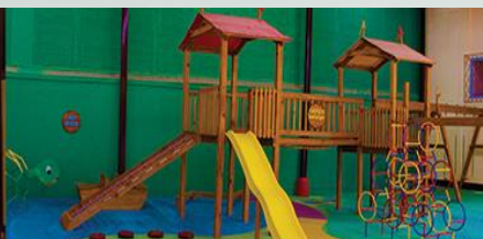
PLAYGROUND PRIVADO PREPRIMARIA