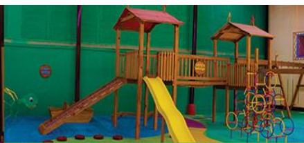
PLAYGROUND PRIVADO PREPRIMARIA